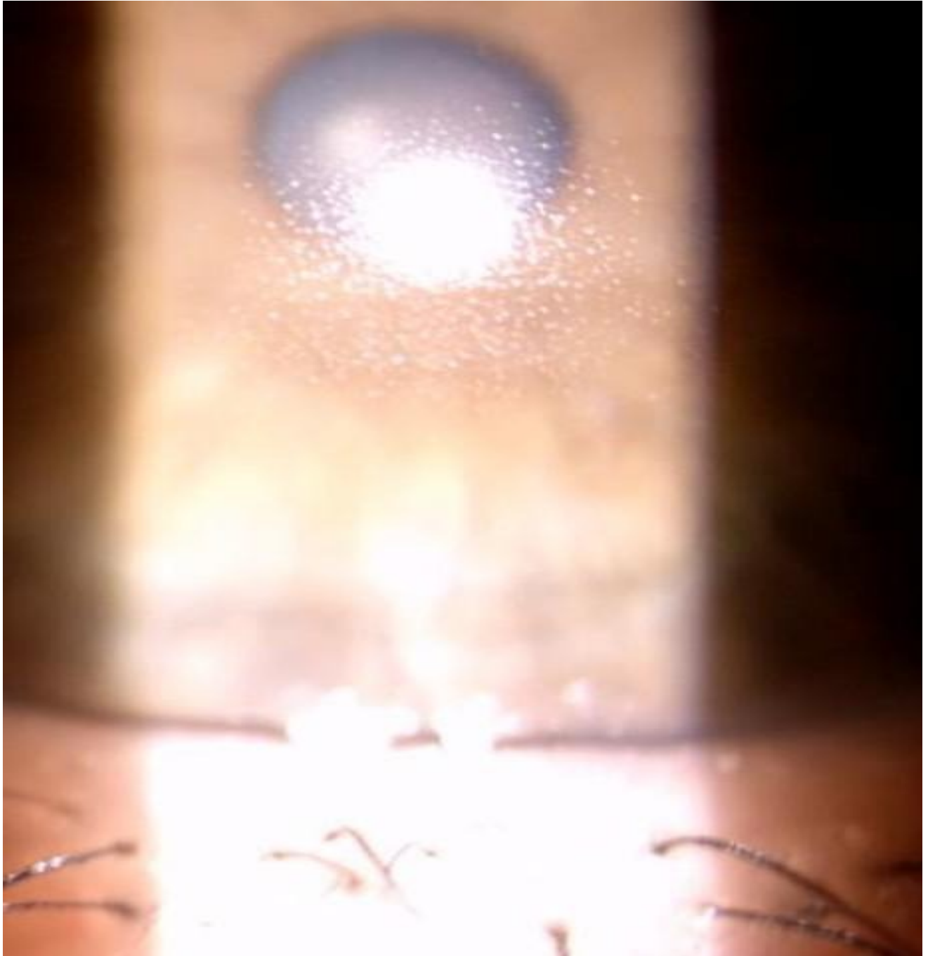
Figura 2. Ridotta bagnabilità della superficie della LAC dopo applicazione.

Strategia di supporto: Instillazione di Blu Yal A ® (sostituto lacrimale con acido ialuronico sale sodico 0,15% ad alto peso molecolare (FHA 1.0) e aminoacidi, senza conservanti), 3 volte/die in fase di allenamento e fino a 5 volte/die nei giorni di gara, con instillazione immediata pre-gara.