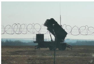
Batterie contraeree all'aeroporto di Rzeszow (Polonia)

2022 – Missione di scouting Dipartimento Nazionale Protezione Civile/Centrale Remota Operazione di Soccorso Sanitario (CROSS, Pistoia)/Regione Toscana/AOU Meyer IRCCS nella città di Rzeszow (Polonia) per operazione MEDEVAC ( Medical Evacuation ) di pazienti pediatrici ucraini con patologia tumorale;