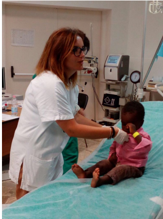
Nel poliambulatorio di Lampedusa