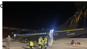
L'ATR 72 della Guardia di Finanza a Rzeszow in attesa del rientro in Italia con i pazienti e il team sanitario del Meyer