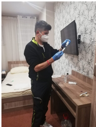
La terapia nell'alloggio di fortuna a Rzeszow in attesa del volo di rientro in Italia